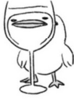
Le canard déchaîné !