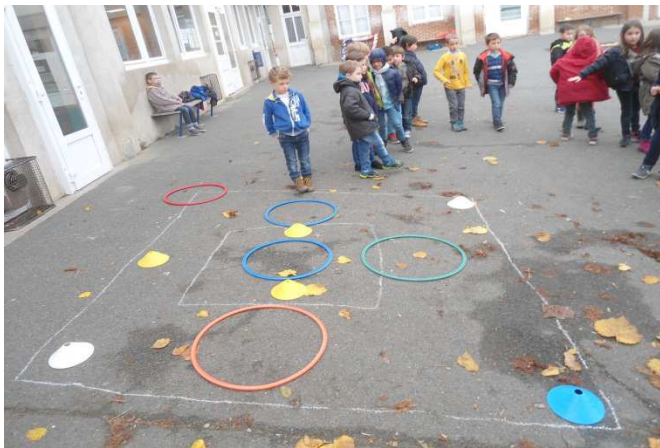
Elèves faisant de la géométrie sur la cour de l'école avec la méthode de Singapour.

En mathématiques, nous utilisons la méthode de Singapour. Cette méthode est utilisée dans plus de 60 pays à travers le monde, où son efficacité auprès des élèves a été mesurée. Singapour est placé premier des pays au classement international TIMSS pour les mathématiques et les sciences, bien loin devant la France, classée en 35 ème position.